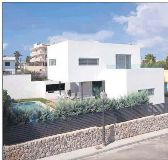
VOLUMEN. Formas geométricas cúbicas sobre esbeltos pilares portantes en el porche.