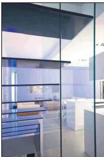
LIGERA. Panel de cristal tras la escalera.