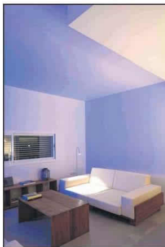
SENCILLEZ. Decoración escueta en el salón.