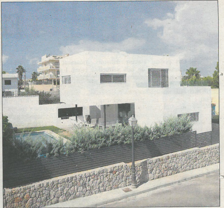
VOLUMEN. Formas geométricas cúbicas sobre esbeltos pilares portantes en el porche.