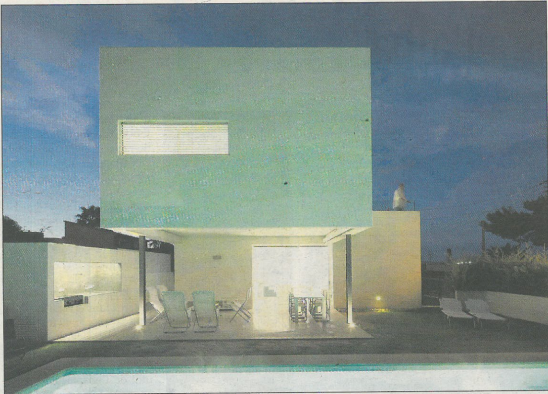
VIDA EXTERIOR. Zona de estar y de cocina en el jardín para aprovechar el buen tiempo.