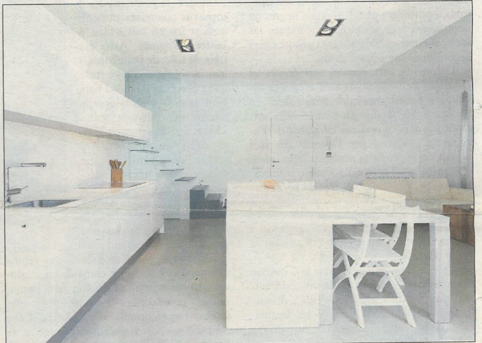
RADIANTE. El blanco domina en la cocina y la zona de comedor.