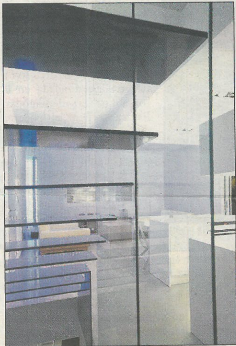
LIGERA. Panel de cristal tras la escalera.