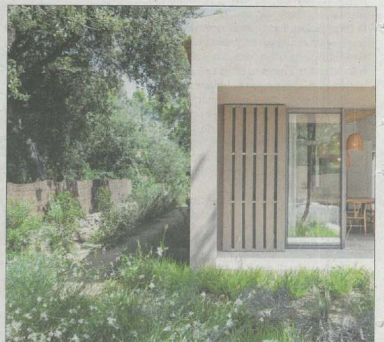
La vivienda se integra en la orografía del terreno.