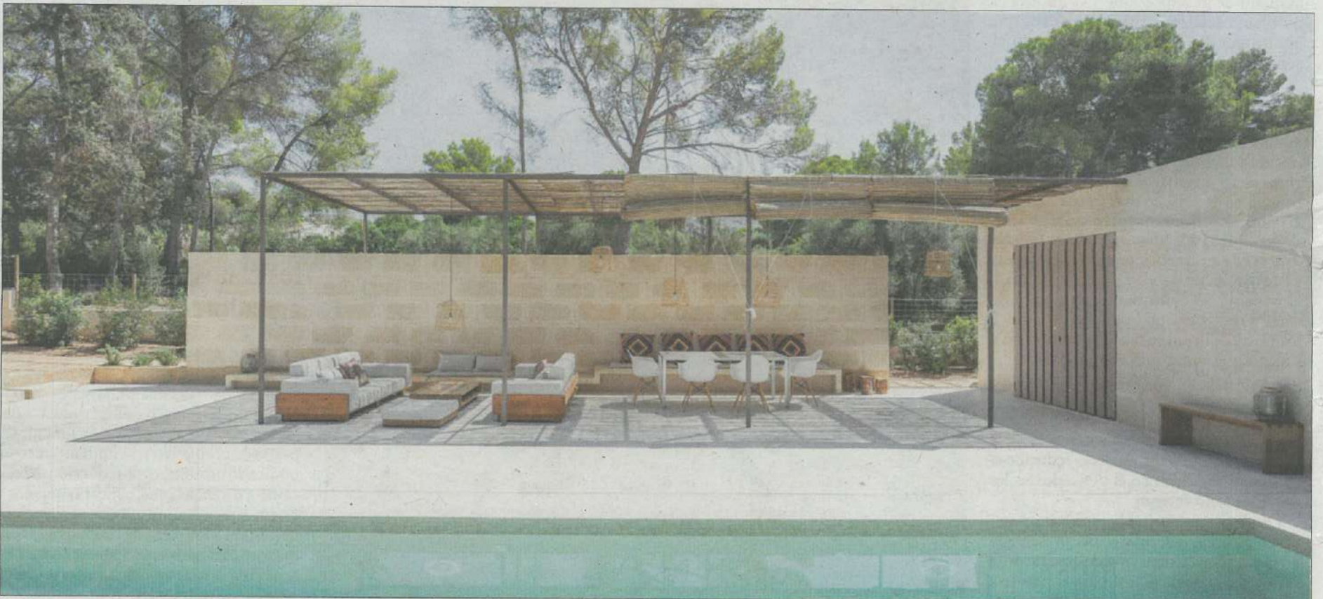
Una vivienda abierta al exterior para los meses de verano con amplias zonas de estar exteriores y piscina.