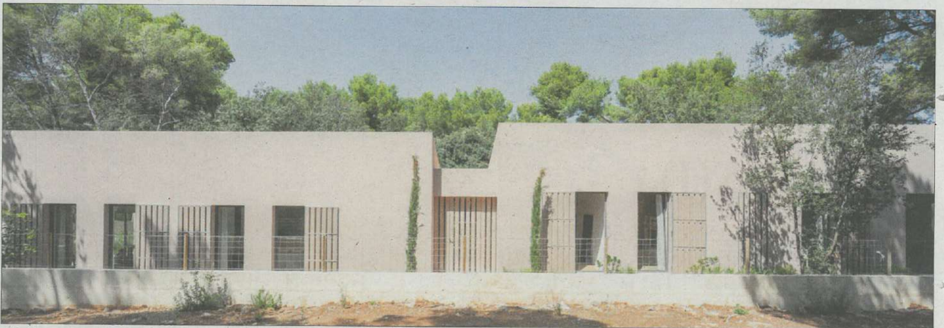
Se ha intentado adaptar la edificación al entorno, manteniendo la arquitectura tradicional con un guiño al vanguardismo.