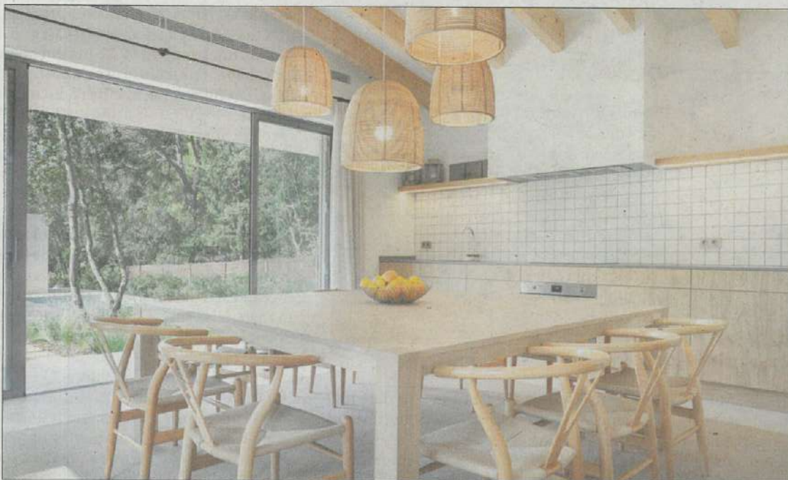
Se han colocado grandes piezas de mobiliario en la casa, como la gran mesa cuadrada del comedor.